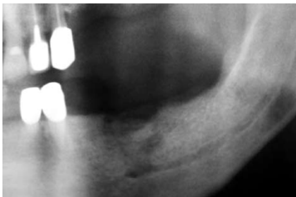
Εικόνα 2. Οστεονέκρωση κάτω γνάθου.

ανοσοκατασταλτικά φάρμακα. Οι ασθενείς που λαμβάνουν ταυτόχρονα διφωσφονικά από το στόμα και κορτικοστεροειδή παρουσιάζουν αυξημένο κίνδυνο εμφάνισης ΟΝΓΑΔ, αλλά και μειωμένη ανταπόκριση μετά τη διακοπή της χορήγησης των διφωσφονικών. Αυτό οφείλεται στην ανοσοκατασταλτική δράση των κορτικοστεροειδών, η οποία προκαλεί καταστολή του οστικού μεταβολισμού κατά τη φάση της χορήγησης των διφωσφονικών, αλλά και καθυστέρηση της επαναφοράς του σε φυσιολογικά επίπεδα όταν αυτά διακοπούν 9 .